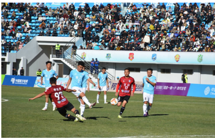
丽江队在滇超联赛中已取得八连胜战绩

作为云南足球版图上最具代表性的两座城市，丽江与昆明之间的绿茵对话跨越了数十年的岁月，本身就是一部云南足球简史。