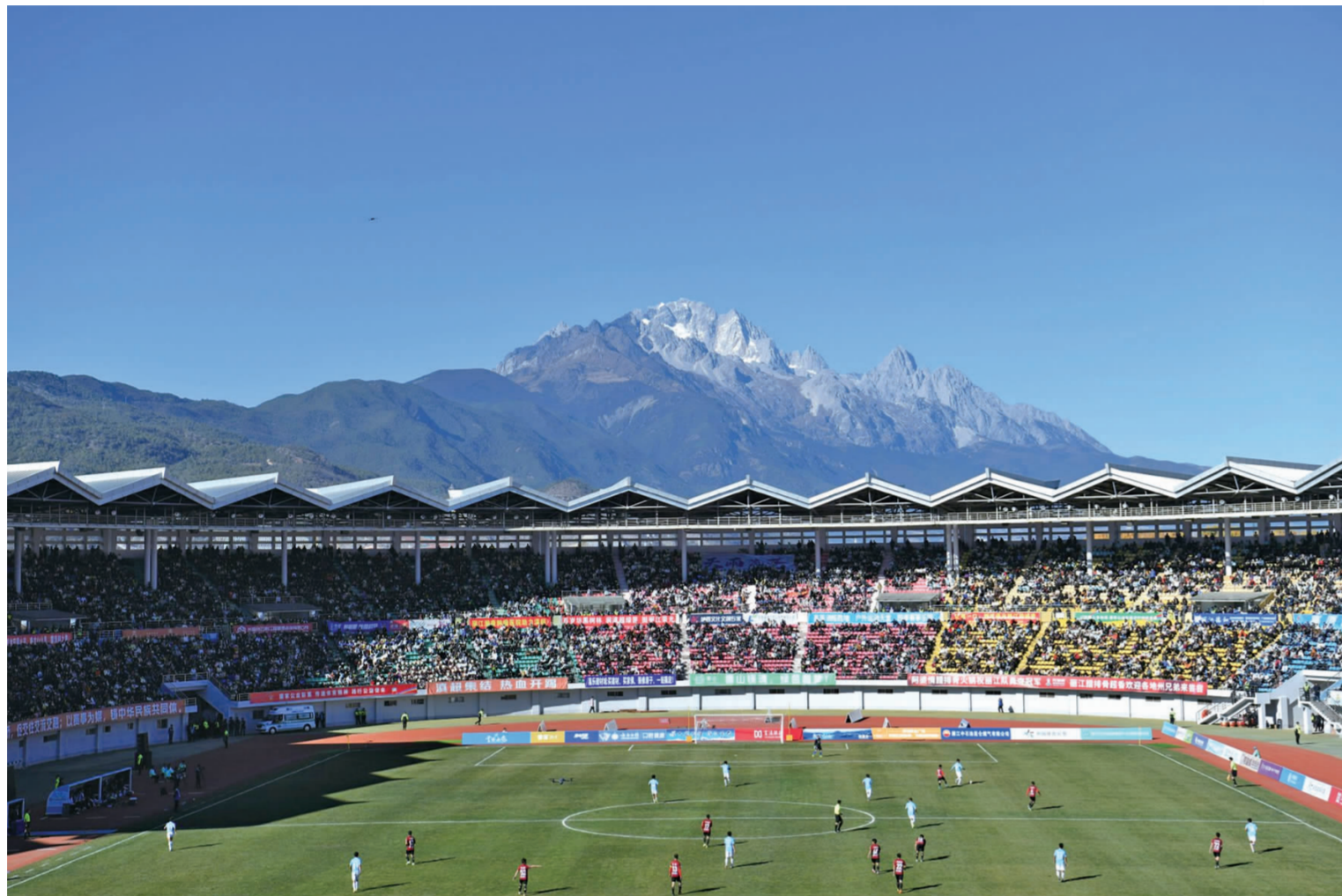
雪山脚下的滇超联赛 丽江融媒图

4月11日15:00，滇超联赛第九轮将迎来本赛季迄今最受瞩目的焦点战役——排名榜首的丽江队坐镇海拔2400米的丽江体育发展中心体育场，迎战积分榜第二位的昆明队。截至目前，丽江队豪取八连胜积21分稳居榜首，昆明队七连胜积20分仅以1分之差紧随其后。这场“价值6分”的榜首之争，既是第一阶段榜首归属的关键战役，也将检验两队的战术韧性与强队成色。