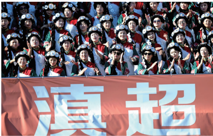
富有民族特色的球迷方阵