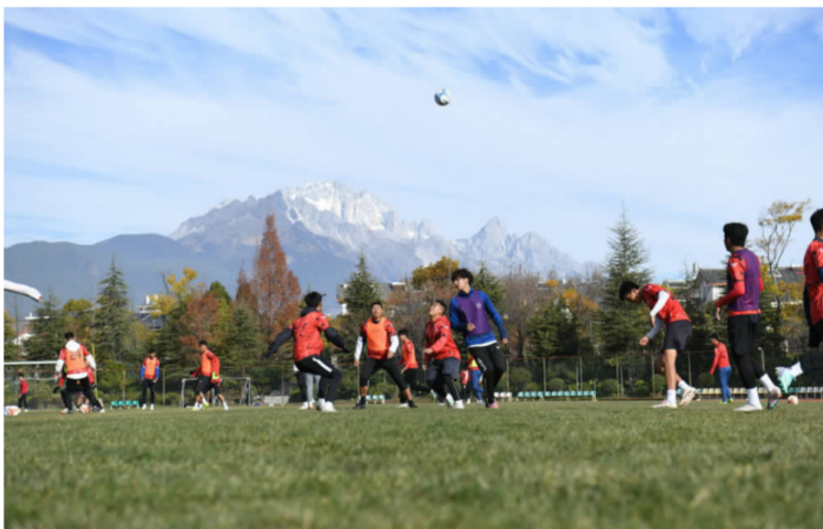
丽江队训练备战比赛(资料图片) 丽江网图

20世纪70年代，是丽江足球人才辈出的黄金时期。据《丽江日报》报道，当时效力于云南省足球队（包括一队、二队）的丽江籍队员达18人。