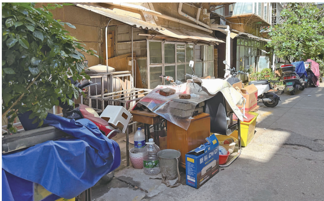
老人堆放的杂物已影响人员出入

这名工作人员表示，这些年来，社区曾联合辖区派出所、街道执法中心、环卫部门等多方力量，先后开展过七八次集中清理行动，社区工作人员也自行组织过多次小型清理。“每次清理完，没过几天老人又会摆出来。我们也联系老人的子女帮忙劝说，可效果并不理想。下一步，我们将持续对老人进行劝导，同时将相关情况上报街道，协商解决办法。”