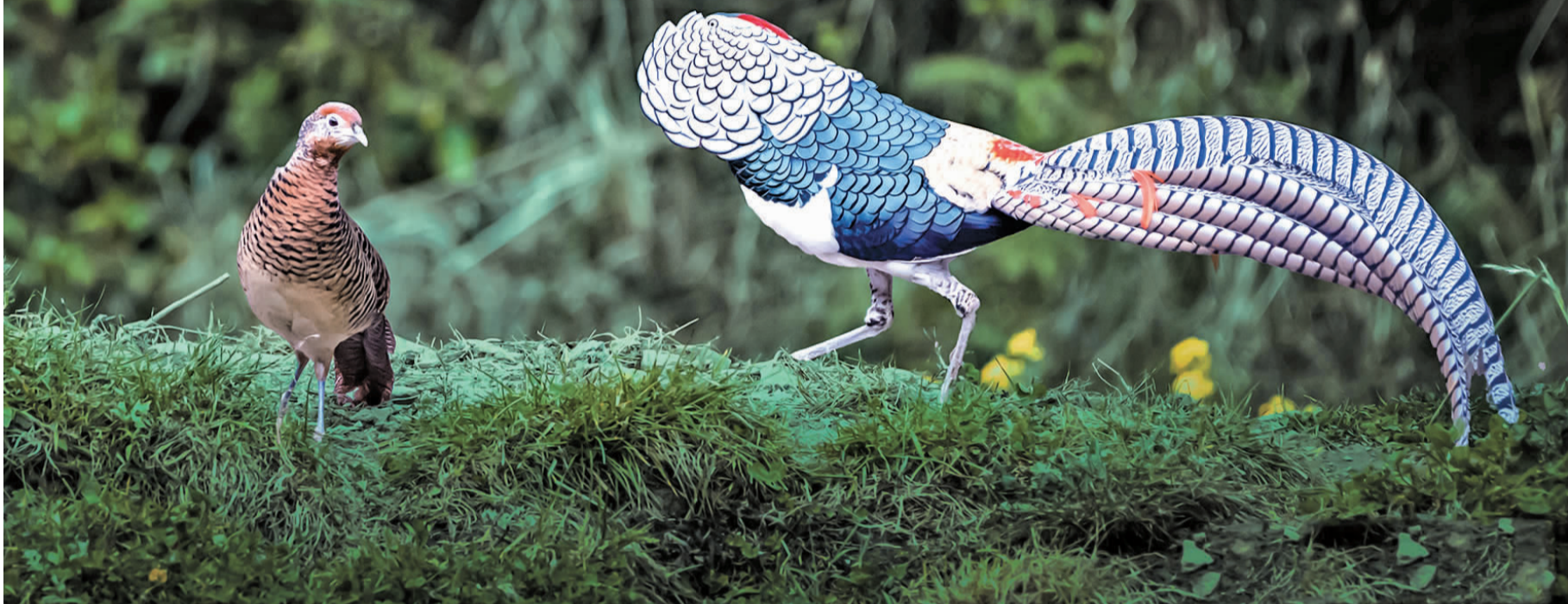
白腹锦鸡竖起头顶的羽冠,努力吸引雌鸟注意

都市时报讯 (全媒体记者 彭德光) 三月春回,正值鸟类繁殖高峰期。3月7日,几名摄影爱好者在昆明金殿后山的金龟山观光园蹲守5个半小时后,成功拍摄到国家二级保护动物白腹锦鸡求偶的珍贵画面。