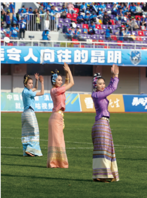
中场休息期间,《来玩西双版纳》精彩上演