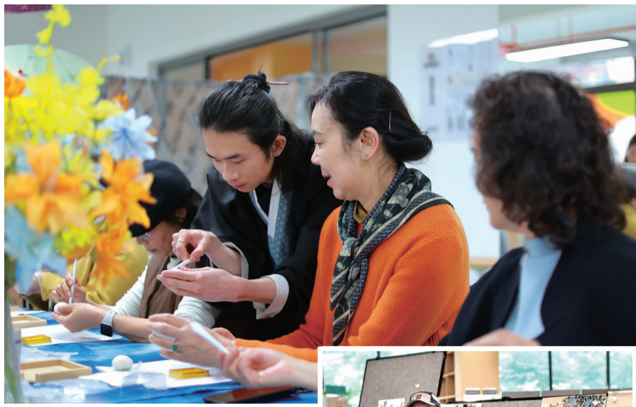
▲映象社区居民制作节庆香牌

夕阳无限好,人间重晚晴。在盘龙区的各个社区新时代文明实践站,移风易俗树文明新风不是空洞的口号,而是笔墨间的热爱、邻里间的搀扶、破茧后的绽放。它打破了老年生活的固有枷锁,摒弃了邻里疏离的陈旧习气,让老人们摆脱了孤独与迷茫,找回了自我与价值,让“老有所乐、老有所为、老有所安”不再是一句口号,而是每天都在发生的幸福日常。在这里,文明新风正通过移风易俗的实践,滋养着每一位长者的晚年,让“夕阳红”绽放出最绚烂的光彩。