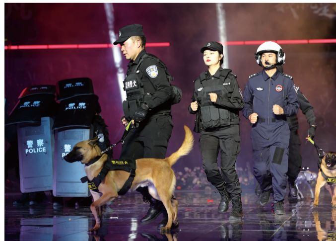
“平凡亦能铸就非凡——我就是滇风”盛典晚会上的精彩瞬间