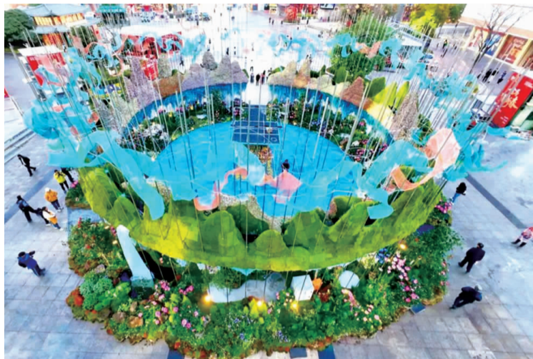
俯拍南屏步行街巨型立体花雕