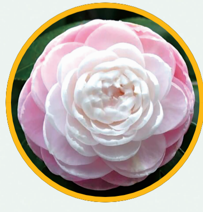
昆明植物园内6000株山茶已陆续进入盛花期