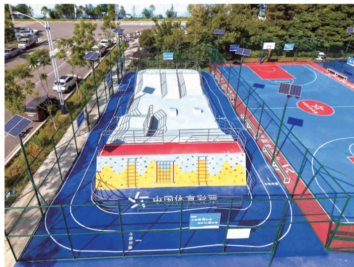
新落成的体彩体育运动公园可满足不同群体的健身需求

云南体彩于2023年开始全面推动中国体育彩票体育运动公园建设。当年，首座公园在昆明市禄劝县民族体育活动中心落成，将沥青篮球场升级为硅PU塑胶场地，加装了LED照明及防护网等设施，并搭配两套公益金援建的健身路径。2024年，楚雄州武定县、保山市腾冲市新增3座中国体育彩票体育运动公园，其中，武定县的公园引入了智能光控、无人值守系统及太阳能供电的智能健身路径，腾冲市的公园则首次建设了羽毛球场。今年落成的中国体育彩票体育运动公园进一步丰富体育设施类型，首次建设了滑板、小轮车场地以及五人