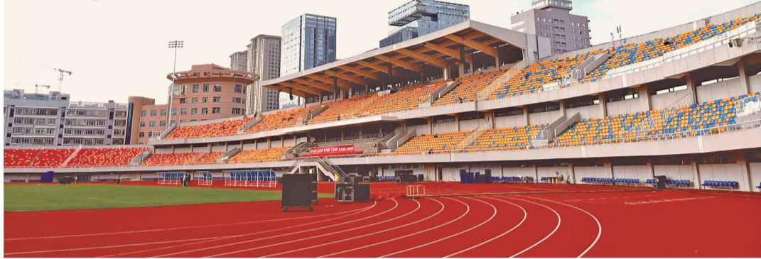
昆明体育场硬件水准实现了跨越式飞跃