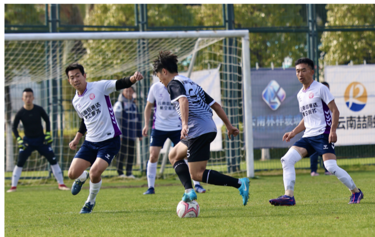
大众组昆明海睿比亚迪对阵刚华足球俱乐部