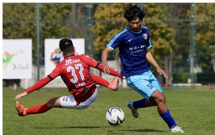
蝉埠融合好友对阵乌合之众