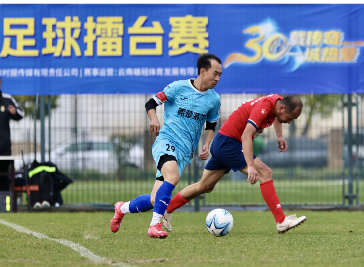
娱乐组 joma 塘顿足球队对阵云南喜麻麻文体俱乐部

12月13日，第30届昆明都市周末杯足球擂台赛娱乐组1/4决赛在云南红塔体育中心打响，经过激烈角逐，云南喜麻麻文体俱乐部、小李子·昆明、中科都菱、昆明雅美足球队分别战胜对手，成功锁定本届赛事娱乐组四强席位。