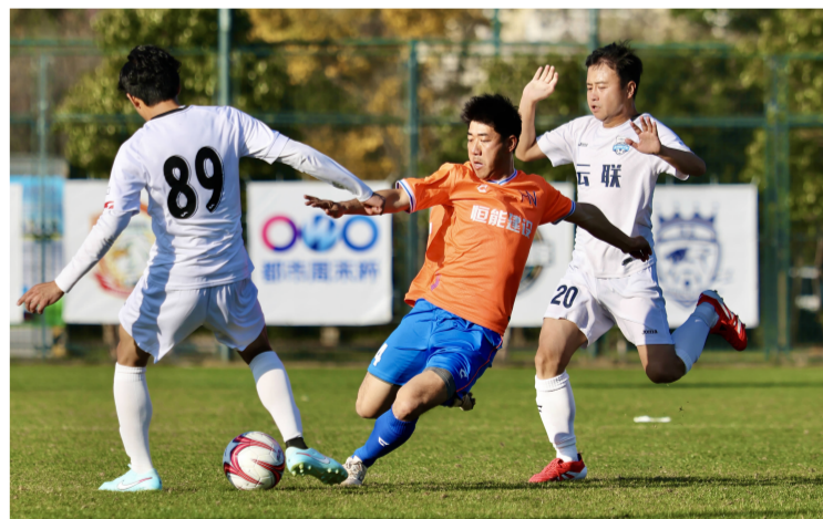
恒能建设对阵云联竞技