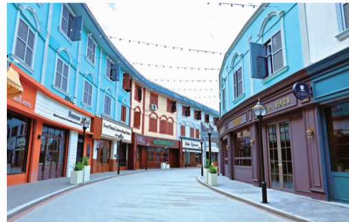
昆明 1937 国际短视频运营中心