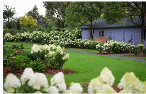
潘祥记梦橙花园打造了 13 个主题花园

近年，滇池旅游黄金岸线文旅创新活力迸发，昆明 1937 国际短视频运营中心、园林策展中心、南小咖等一批融合生态、艺术与潮流体验的新场景相继涌现，推动滇池旅游从传统观光向深度体验转型，实现从“流量”到“留量”的质变。