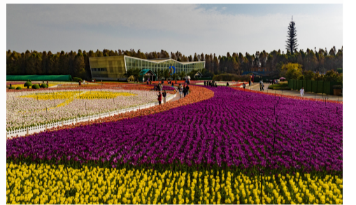
捞渔河湿地公园郁金香展 都市时报全媒体记者 李浩

近年来,随着滇池生态治理、滇池沿线村落提升改造、滇池旅游黄金岸线打造等工作持续推进,滇池绿道串联起的“生态经济链”,不仅重构了滇池沿线文旅空间,更激活了“生态+文化+经济”的融合发展新动能,滇池已成为广大游客来到昆明必去、必看、必游的旅游目的地。