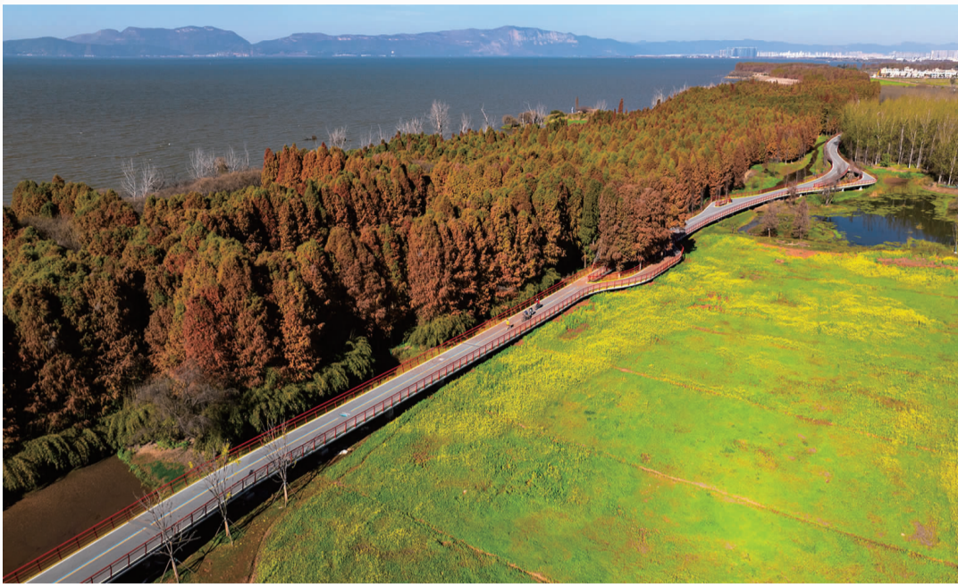
滇池绿道承担着环湖生态屏障、城市山水画廊、文化旅游长廊三大功能