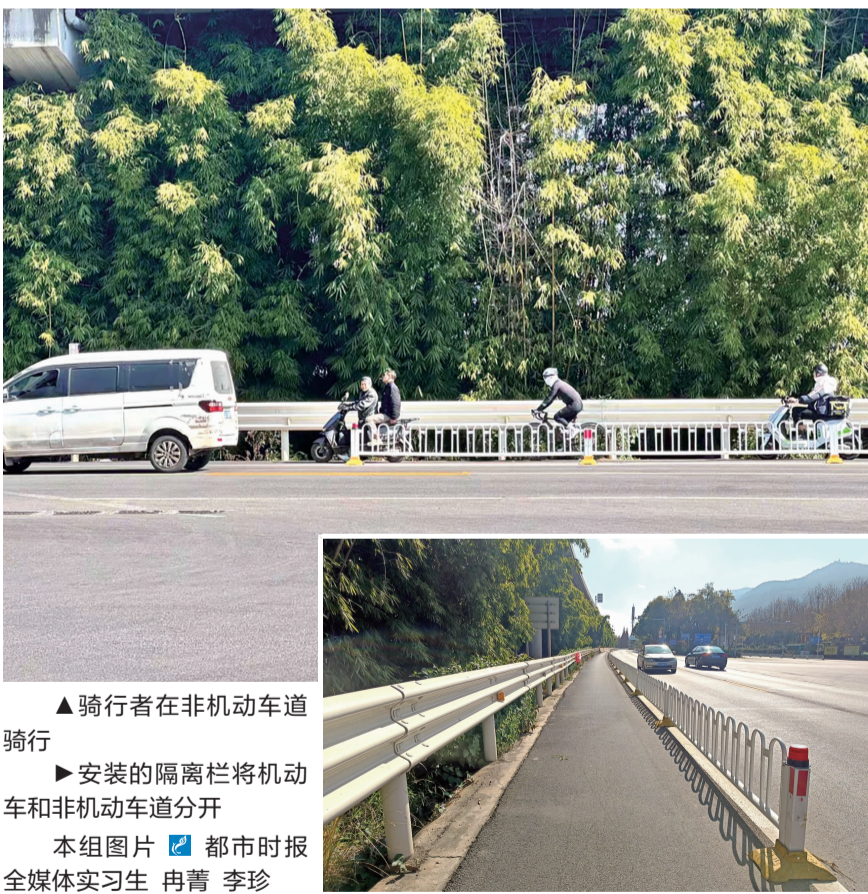
▲骑行者在非机动车道骑行 ▶安装的隔离栏将机动车和非机动车道分开