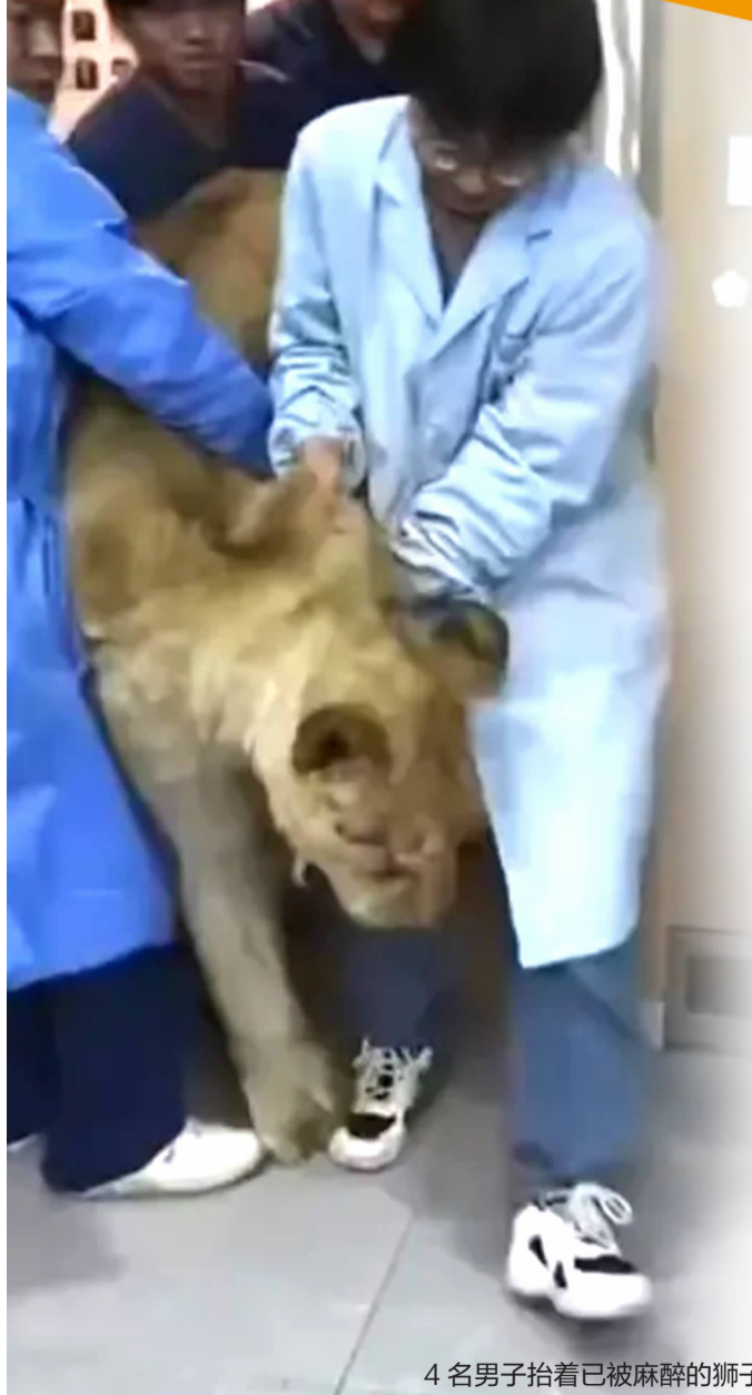
4 名男子抬着已被麻醉的狮子

12月2日，河北石家庄一家动物医院发布了一段为狮子做 CT 检查的视频，引发网友热议。