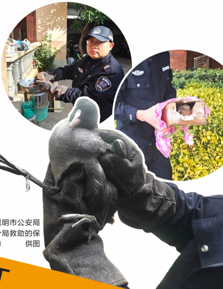
昆明市公安局东川分局救助的保护动物

为确保珠颈斑鸠和灰林鸮得到更专业的照顾，25日，民警将它们一并送至昆明市濒危野生动物救助中心。目前，3 只动物状态稳定，待其完全康复并经专家评估符合放生条件后，将放归自然。