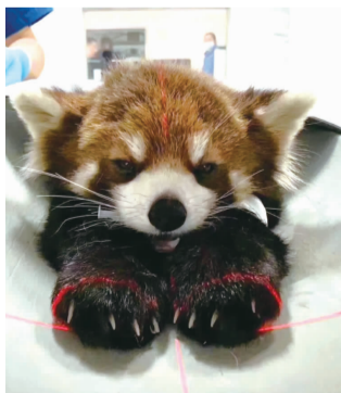
小熊猫 本组图片 网络截图