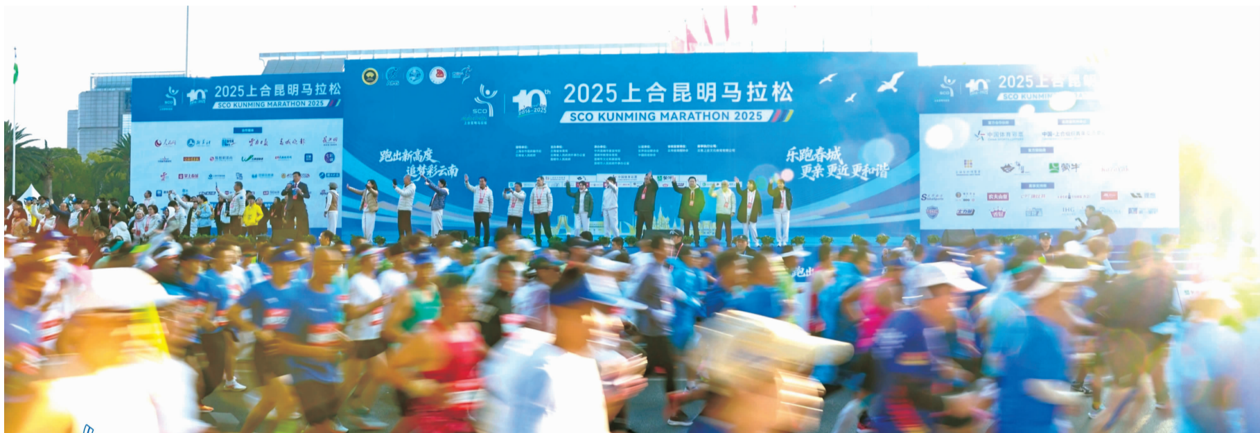
11月30日上午8点,2025 上合昆明马拉松在云南海埂会堂开跑

11月30日上午8点,2025 上合昆明马拉松在云南海埂会堂鸣枪起跑。全球 20 多个国家和地区的 2.6 万名跑者齐聚春城,共赴这场具有里程碑意义的“十年之约”。