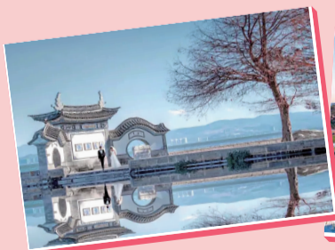
龙龕码头： 经典机位,冬日效果绝美