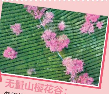
无量山樱花谷： 冬季樱花如云,限定浪漫