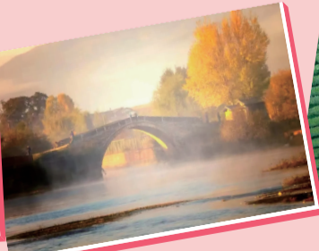
沙溪古镇： 茶马古道遗风,时光慢递