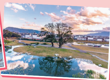
网红树： 海舌夫妻树,自然见证者