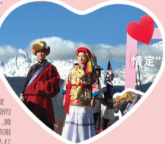
在梅里雪山下举办的“情定云南”推介活动现场(11月11日摄)