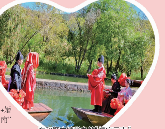
在和顺古镇举办的“情定云南”推介活动现场(11月13日摄)