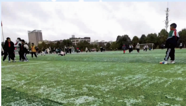
嵩明降下小雪

据景区监控系统记录,降雪于凌晨2:30左右开始,下坪子至轿顶区域出现明显降雪过程并形成薄层积雪。至清晨时分,山体已披上银装。截至上午10时许,四方景至月亮岩片区仍有零星小雪飘落。此次降雪标志着轿子山冰雪旅游季的序幕正徐徐拉开,景区已做好相关保障工作。