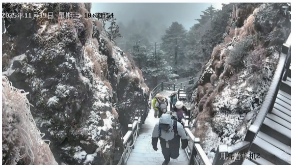
轿子山降下第二场雪 “轿子山景区”微信公众号图