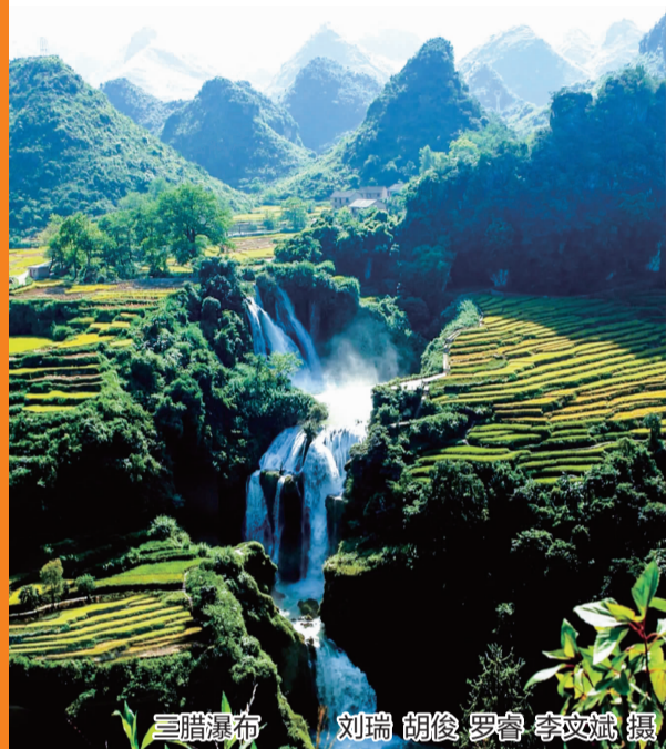
三腊瀑布