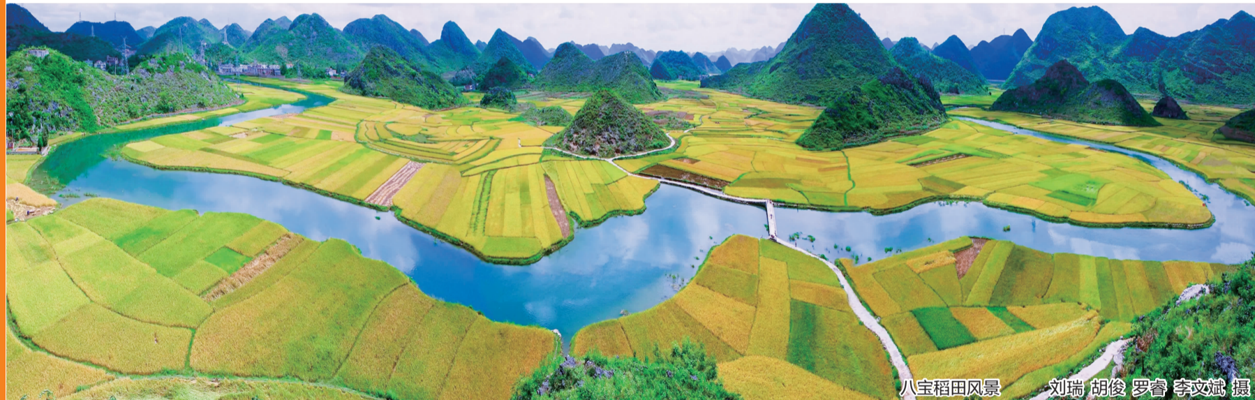
八宝稻田风景