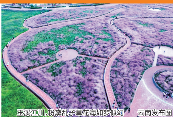
玉溪江川,粉黛乱子草花海如梦似幻 云南发布图