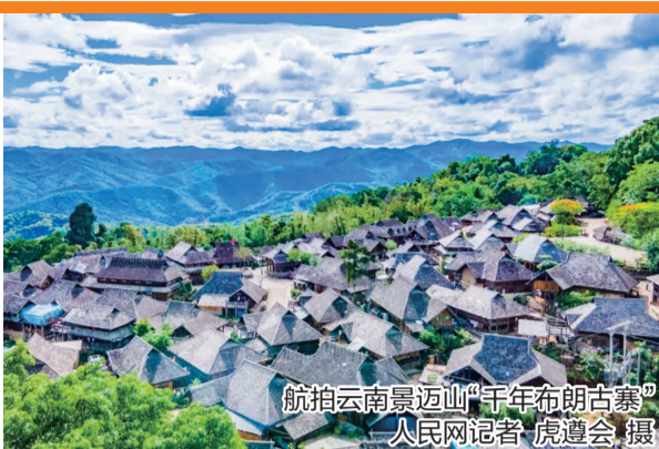
航拍云南景迈山“千年布朗古寨”