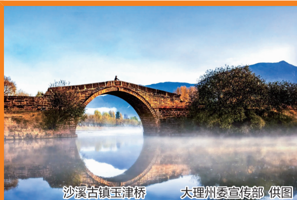
沙溪古镇玉津桥