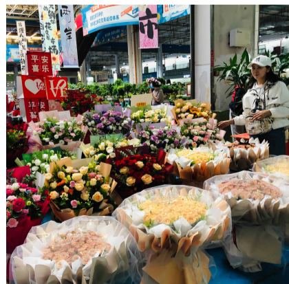
红色、粉色玫瑰花束占据斗南花市C位

而在零售端,因红色、粉色玫瑰供货紧缺价格上涨,不少摊主采取了“减枝保价”措施,将玫瑰由20枝/扎拆分成10枝/把或9枝/把销售,单价25元/把。