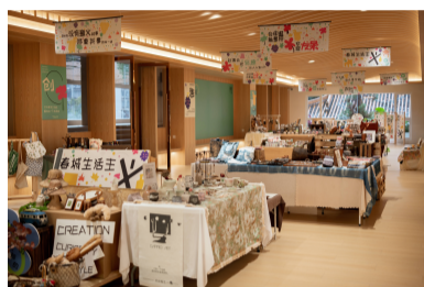
百里春秋城市会客厅