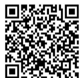
扫码查看 晋级项目名单

另外，组委会特别说明，初赛海选成绩以平均分计算，60 分以上为晋级线，初赛成绩不带入复赛阶段，所有晋级项目将在复赛中重新展开角逐。如需了解晋级项目详细名单或咨询大赛相关事宜，可联系大赛组委会办公室，联系电话：0871-62122455，地址：东川区春晓路 36 号三楼办公室。