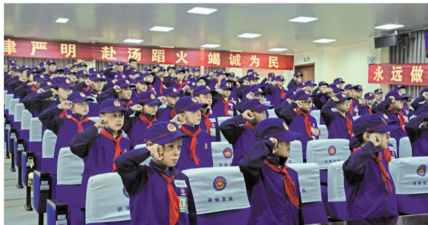
90 名“蓝焰少年”庄严宣誓 都市时报全媒体记者 郑荣行

都市时报讯（全媒体记者 郑荣行）7 月 28 日，由共青团云南省委、云南省少工委、云南省消防救援总队联合主办的“强国少年·筑梦蓝焰”2025 年青少年消防体验夏令营，在云南省消防救援总队训练与战勤保障基地拉开帷幕。此次活动旨在进一步丰富青少年假期生活，增强青少年安全意识与自护能力，来自全省的 90 名 8—14 岁少先队员将参与其中，开启为期 6 天的沉浸式消防实践学习之旅。