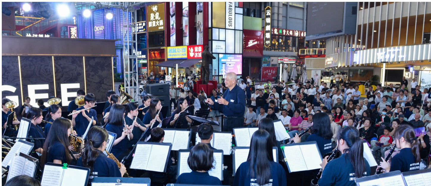
澳门管弦乐团在云纺文创园内的云纺心舞台举行专场演出

流。聂耳与冼星海同为杰出的音乐家,一位是出生在昆明的人民音乐家,一位是出生于澳门的著名作曲家。澳门管弦乐团纪念冼星海诞辰120周年暨聂耳逝世90周年音乐会于今年7月和8月在澳门、番禺、昆明三地举办。