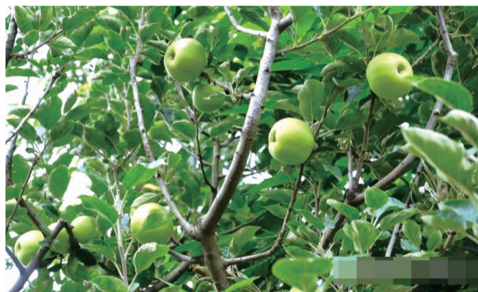
果园里饱满圆润的苹果缀满枝头

都市时报讯（全媒体记者 黄晓婧 实习生 尚迎春 通讯员 佟怡海达 李奇 谢钢）眼下，安宁连然街道武家庄山光甸村瑞豪生态农庄的山地苹果陆续成熟，已开始接受游客入园采摘。