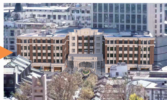
外立面修缮后效果图