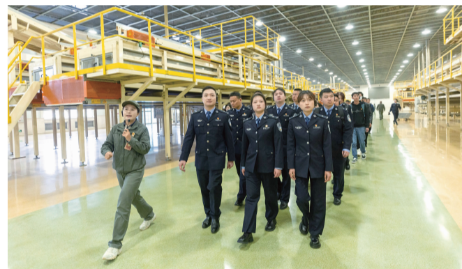
团员青年们参观制丝车间