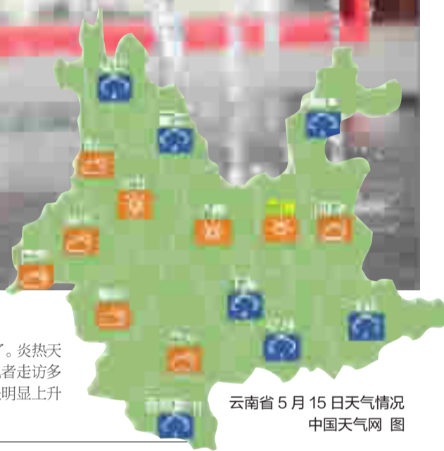
云南省5月15日天气情况

5月以来,昆明连续出现高温天气,气温突破31℃,让广大市民直呼受不了。炎热天气下,西瓜、冷饮等消暑食品热销,桶装水送水量直线上升。昨日,都市时报记者走访多家水果店、冷饮店发现,最近几日是4月销量的2—3倍;桶装水的销量也呈明显上升趋势,送水工忙得不亦乐乎,部分停车场洗车价格有所上涨。