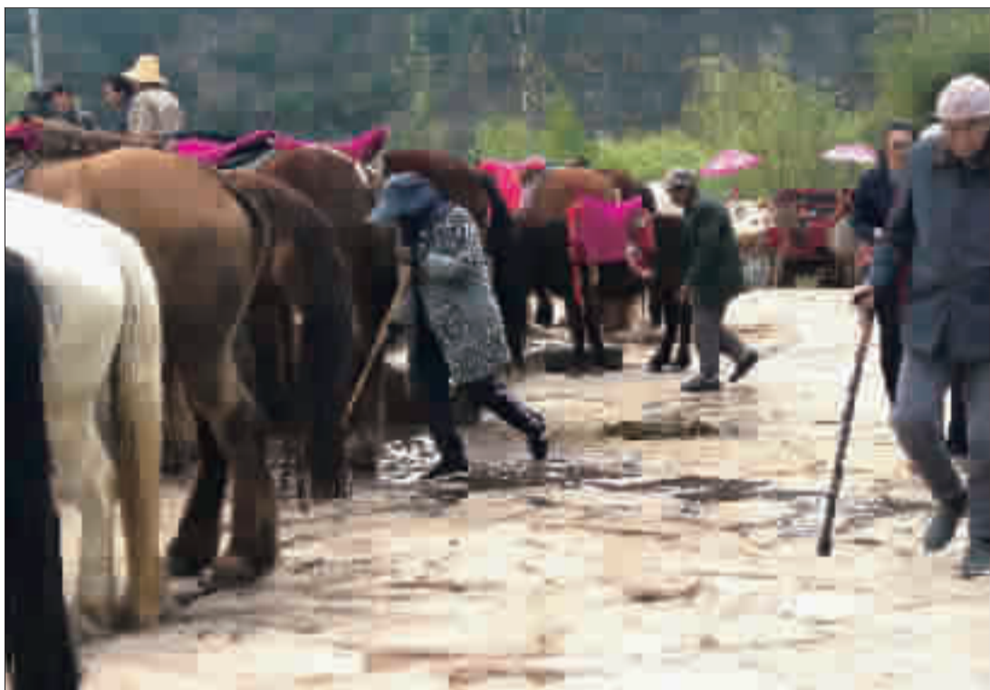
马尿随地排,马主人直接将粪便扫进油菜花地里