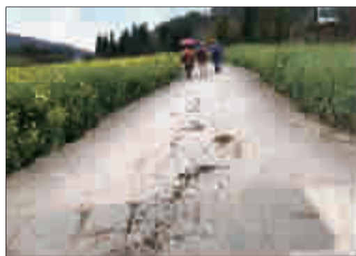
马匹沿路排泄的粪便