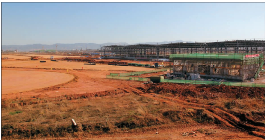
今年3月,科研区、总装车间等一期项目土建工程就将完工