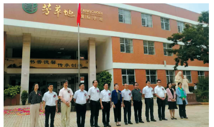
芳草国际学校 都市时报记者 毛亚南

西山区芳草国际学校将于 9 月 1 日正式开班办学，计划招生 6 个教学班，270 人；招收原德亨学校划片范围的符合入学条件的适龄儿童，即：陆家社区含社区内小区及地段内机关、企事业单位、部队。