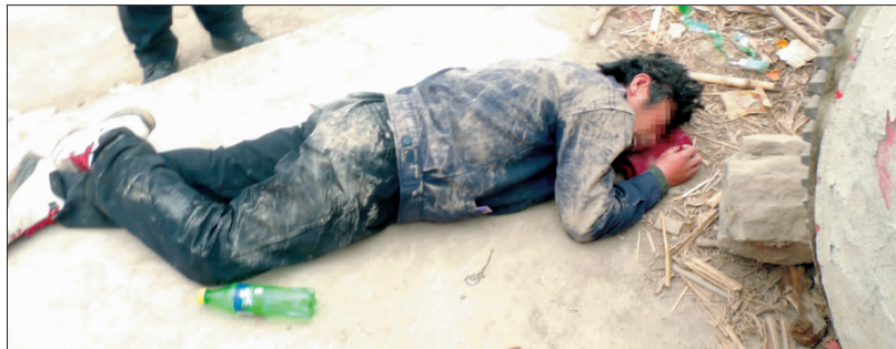
黄某昏迷倒地

都市时报讯（首席记者 程浩 通讯员 肖晓 罗兆洪）大关男子黄某胃不舒服，买了胃药后没找到水，就用雪碧服药，结果突然昏迷倒地，幸亏民警及时赶到将他送往医院，经过抢救才脱离危险。